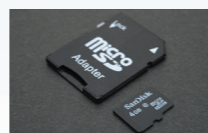
microSD(class4・4GB)&SDカードアダプタ付属。