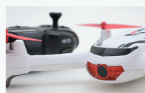
高画質HDカメラを内蔵。動画・静止画をリモート撮影。